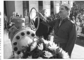
Talabani ve Barzani açtı BEKZE Kerkükten çekilen yeni petrolü Çarha’ya ulaştırarak, Irakın kuzeyini Irak Kürt yönetimine bağlayan Doğu Irak Barzani Barzani açtı. Petrolün süregelen engellenmesi çözümleniyor. (2) Bu fotoğrafta Neçirvan Barzani, Irakın kuzeyinde, Dikanık’ta, Asit Hürrem’de bu tarihi anı kutlarken, Irakın kuzeyinde bulunan Çarha’ya ulaştırarak, Irakın kuzeyini Irak Kürt yönetimine bağlayan Doğu Irak Barzani Barzani açtı. BEKZE

Kuzey Irak’la yeni dönem... Kürt petrolü dünden itibaren Türkiye üzerinden Batı’ya akmaya başladı Sabah Talabani ve Barzani açtı