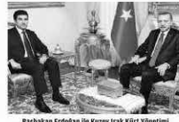
Başbakan Erdoğan ile Kuzey Irak Kürt Yönetimi Başbakanı Barzani’nin görüşmesi yaklaşık 3 saat sürdü.

Türkiye’nin jeostratejik önemini artıracak Kuzey Irak petrollerinin dünyaya taşınması projesi, Başbakan Erdoğan’ın Diyarbakır buluşmasıyla Bağdat’la sıcak ilişkilerle sona yaklaştı. Kürt yönetimi’nin Başbakan Ankara’da Başbakanı görüşmesi ve anlaşma mutabakatı sağlandı.